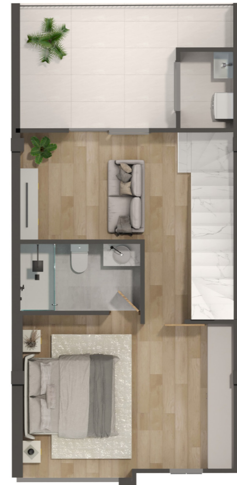
PRIMERA PLANTA ALTA