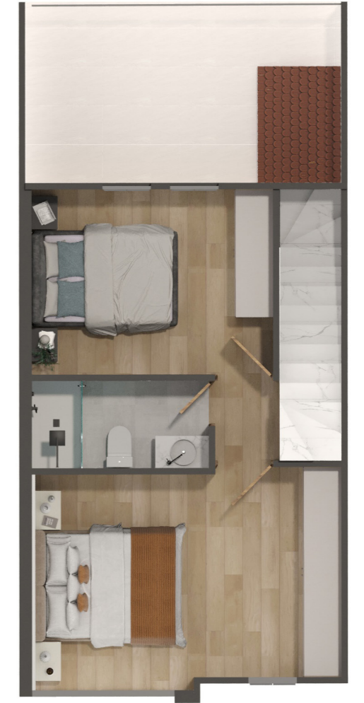
SEGUNDA PLANTA ALTA