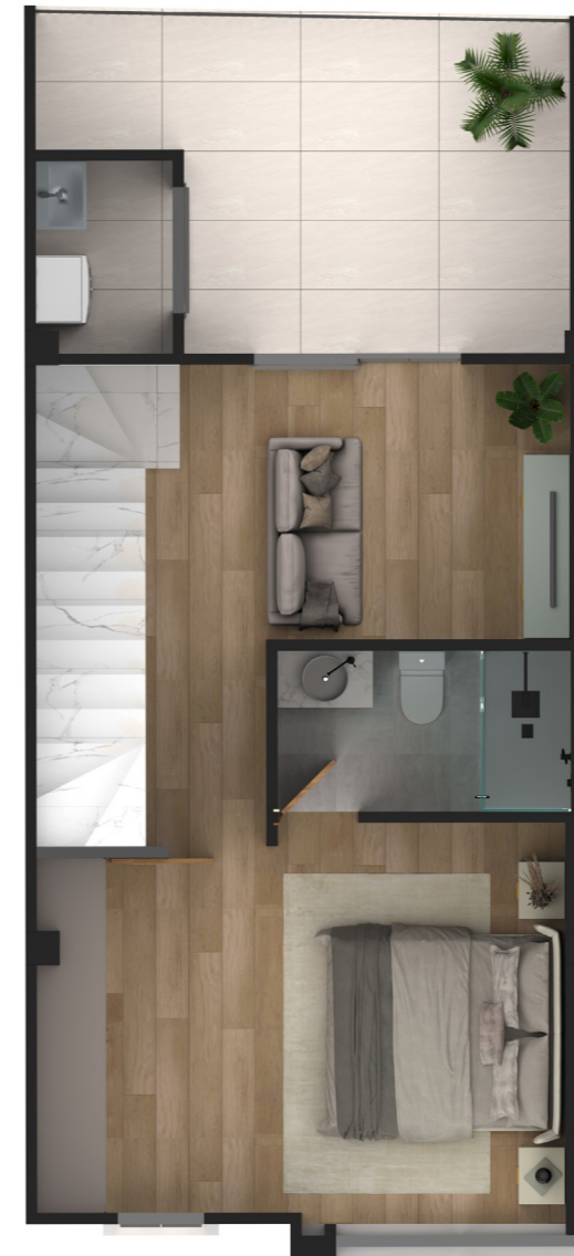
PRIMERA PLANTA ALTA