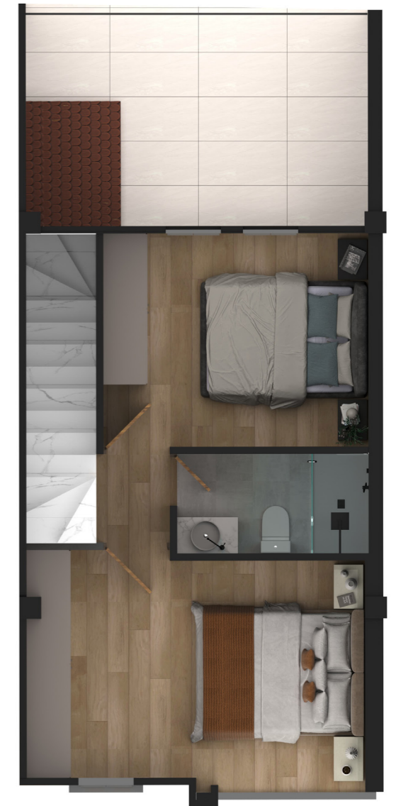
SEGUNDA PLANTA ALTA